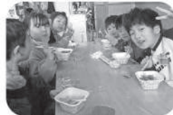
「昼食会」お弁当を注文して、 みんなで食べました