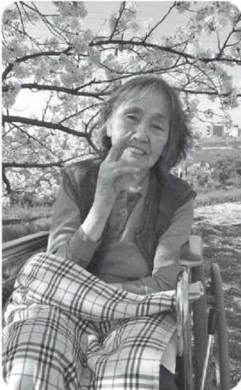
桜満開！天気も良く楽しいドライブ