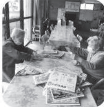
チラシでゴミ箱折りのお手伝い