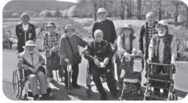
上堰湯公園に笑顔の花も満開です