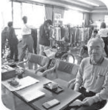
古町ハイカラ洋服移動販売が大盛況