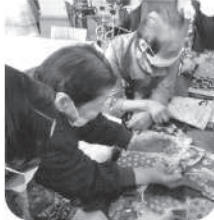
さあどうぞ！小袋選び迷います