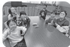
新しいお友だちとも 仲良しです！

今年度もひまわりクラブが子ども達にとって、安心できる居場所になれるよう、精一杯支援させていただきます。今年度もどうぞよろしく願いいたします。