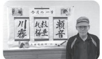
桜をテーマに「今月の一筆」