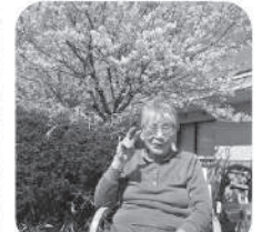
桜と一緒にいい笑顔