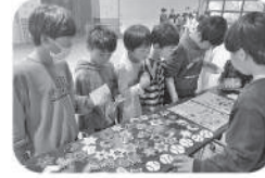
手作り作品を並べて 「いらっしやませ〜！」