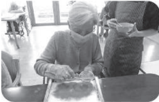
おやつにティラミス作り