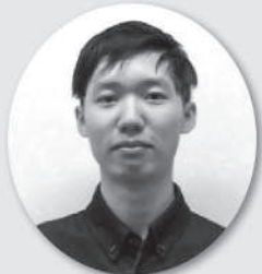
新採用 ダン・ダン・ドゥック

〒950-1121 新潟市西区板井604番地 TEL 025-377-1165 FAX 025-377-1133