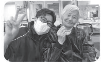
レクの合間にいい笑顔！