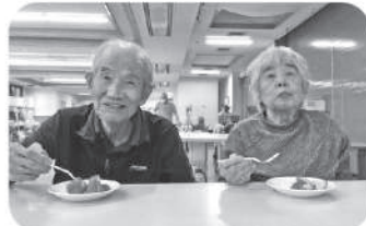
ご家族からいちごをいただきました