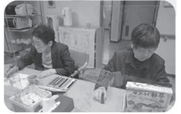
ワニワニ パニック!!