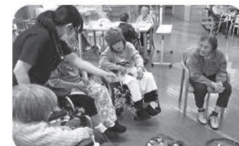
皆さんお手玉を一生懸命投げています