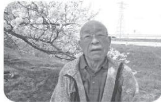
お花見ドライブ 桜を背景に