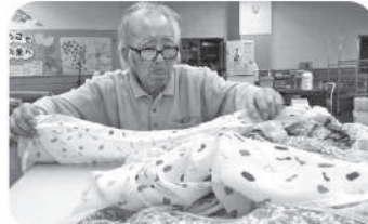
日常の一コマ、エプロンたたみ