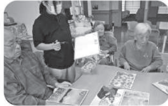
大きなかるた 何枚取れるかな