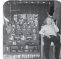
お嬢様とハイポーズ！