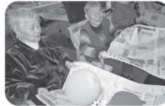
風船渡し 上手く渡せるかな