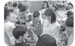
「新入生歓迎会」上級生から 1年生にアイロンビーズをプレゼント