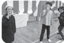
「進級お祝い会」 サッカーゲーム☆