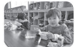
すき家のお弁当を みんなで食べました♪