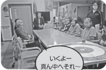
いくよー 真ん中へそれ〜