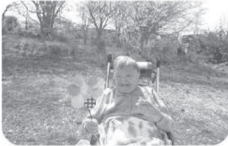
中庭でお花見 風で風車がよく回る