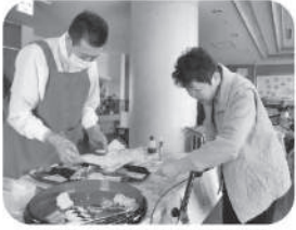
復活！生寿司バイキング