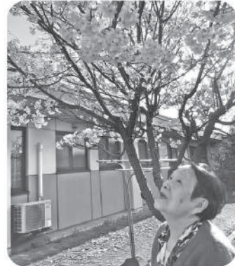
満開の桜、今年の桜は如何ですか？