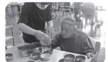
フルーツやアイスのをせて 美味しいおやつが完成