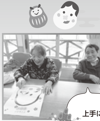
福笑い 上手にできたかな？