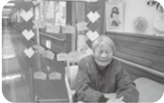
新年の願い事を絵馬に込めて♡