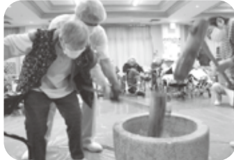
石臼で昔取った杓柄「エイヤー」