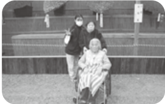
弥彦菊祭りではイ！ポーズ！！