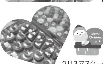
クリスマスケーキ美味しかったよ♡