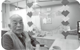
絵馬に願いを！世界平和！！