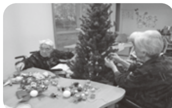
クリスマスツリーの飾り付け