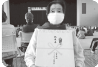
潟東敬老会で米寿のお祝い