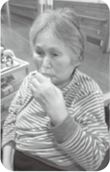
美味しい甘酒でお祝いだ♡