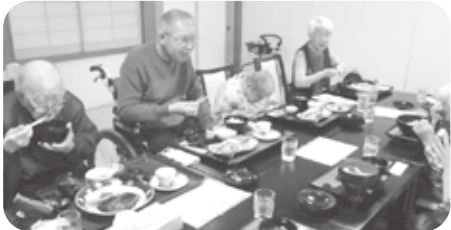
「レストラン越」の座敷で外食ツアー、皆様大満足