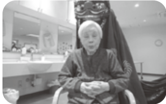
今年も無病息災でね♡