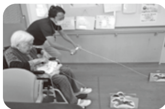
勝負！糸巻どっちが早いでしょう！