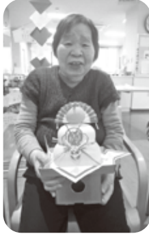
新年のご挨拶、あけましておめでとう