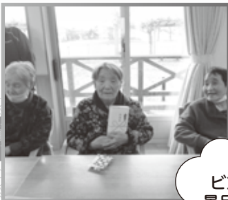
ビンゴで 景品ゲット!