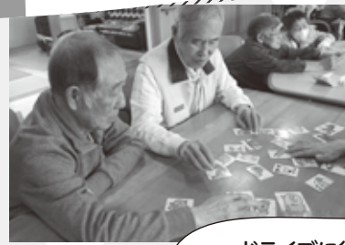
ドライブに行ったり、 ジェンガなどのゲームや 工作を行ったりしました