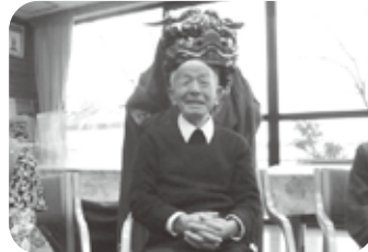
今井地区の神楽で厄払い