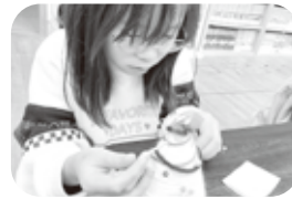
＜クリスマス工作！色とりどりの素敵なツリーができました。＞