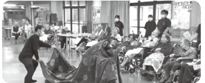
虹の里に獅子舞が来園！皆さん、楽しくご覧になりました