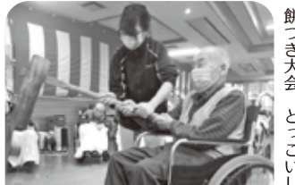
餅つき大会 どんこいしよく