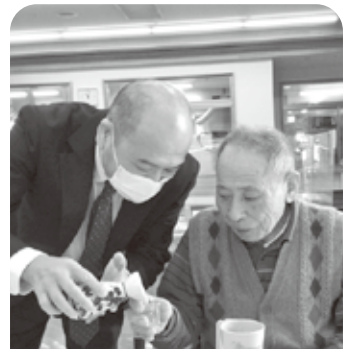
園長からのお屠蘇です 今年も良い年になりそうですね