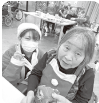
クリスマス会でサンタさんの格好をしました