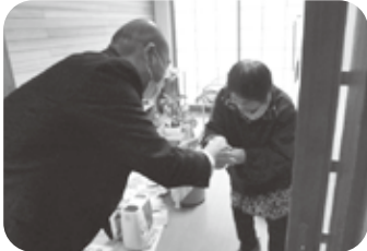
新年のお屠蘇を園長より