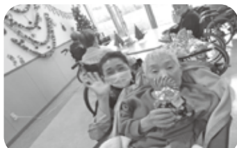
クリスマスプレゼントをもらいました