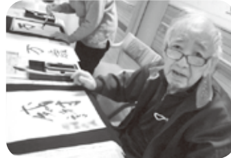
令和6年の書初め・私の気持ちです