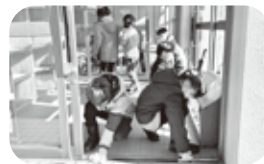
みんなでクラブの大掃除！ピッカピカになったね。