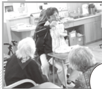
二人羽織でお化粧と 羊かんを食べるのに挑戦! お化粧後は記念写真♪