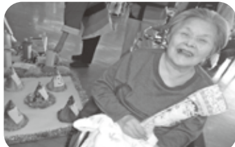
開園祭 ゲームの景品はアヒル隊長！