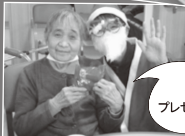
サンタさんから プレゼントを貰いました☆