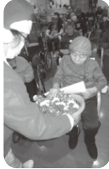
サンタさんからのプレゼント♡