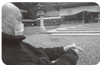
弥彦神社にお参りに