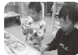
＜クリスマス工作「スノードーム」＞