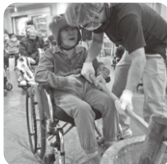
新年会でお餅つき♪ 美味しいお餅ができました