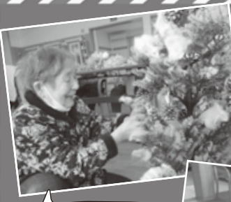
クリスマスツリーの 飾り付けや ケーキ作りを楽しみました