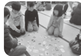
昔ながらの遊びを楽しんだ「新年カルタ大会」

今年度も残りわずか。また一つ学年が上がり、新一年生を迎える季節になります。これからもぐんぐんと伸び続ける子どもたちの力強い成長の芽を、私たちは「土」のように土台となり支えながら、一日一日を大切に過ごしていきたいと思ひます。