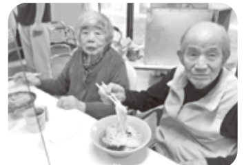
出前レクにて、久しぶりの ラーメンとカツ丼をどうぞ