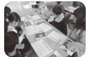
大盛り上がり！「クリスマスビンゴ大会」