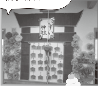
手作りのいずい神社に 絵馬を飾りました

新しい事業所になってから迎える初めての新しい年です 今年は福笑い・ビンゴゲーム・職員による二人羽織などを楽しみました♪