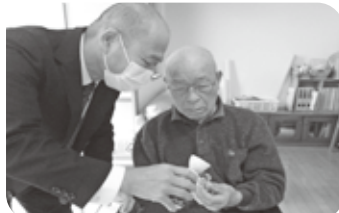
園長からのおとそで新年の始まり