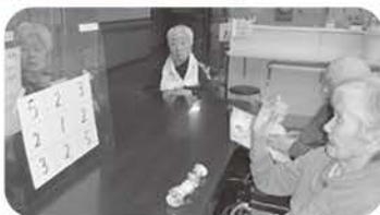
狙いをつけて的あて!