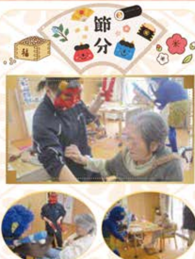
鬼は外、福は内 厄を祓って福が舞い込みますように！