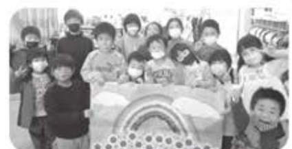
クイズラリー!チームの皆で考えています...

ひまわりクラブが子どもたちにとって安心できる場のひとつとなるよう、職員一同、丁寧に支援してまいります。今年度もクラブ運営へのご理解とご協力をどうぞよろしくお願いいたします。