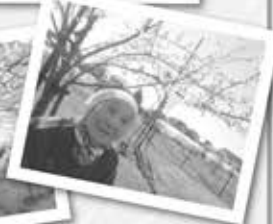
待ちに待った春の訪れ、 満開の桜の下で日向ぼっこ。ほっこりしますね (^_^)v