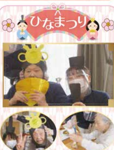
お客様の飾りをつけてすまし顔☆ ひな祭りケーキのトッピング♪美味しくできました。