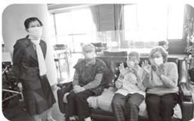
綺麗どころが女子会団楽