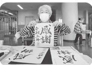
書初めしてみました!