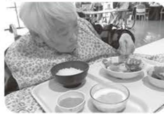
本日の昼食はシーフードカレーと フルーツヨーグルト