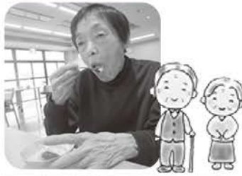
鬼にも、笑顔で圧勝ね♡