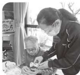
新年のお屠蘇どうぞ