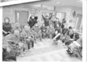
鬼は外、福は内！ 最後はみんなで仲良くハイポーズ！