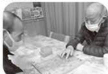
早打ち将棋で、いざ勝負