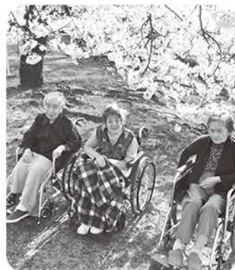
お花見ドライブにて 白根総合公園へ行った際の一コマ