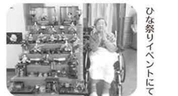
ひな祭りイベントにて