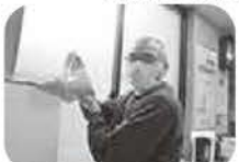
米櫃入れなら俺に任せろ!