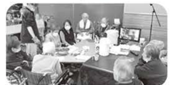
チョコレート作りに挑戦