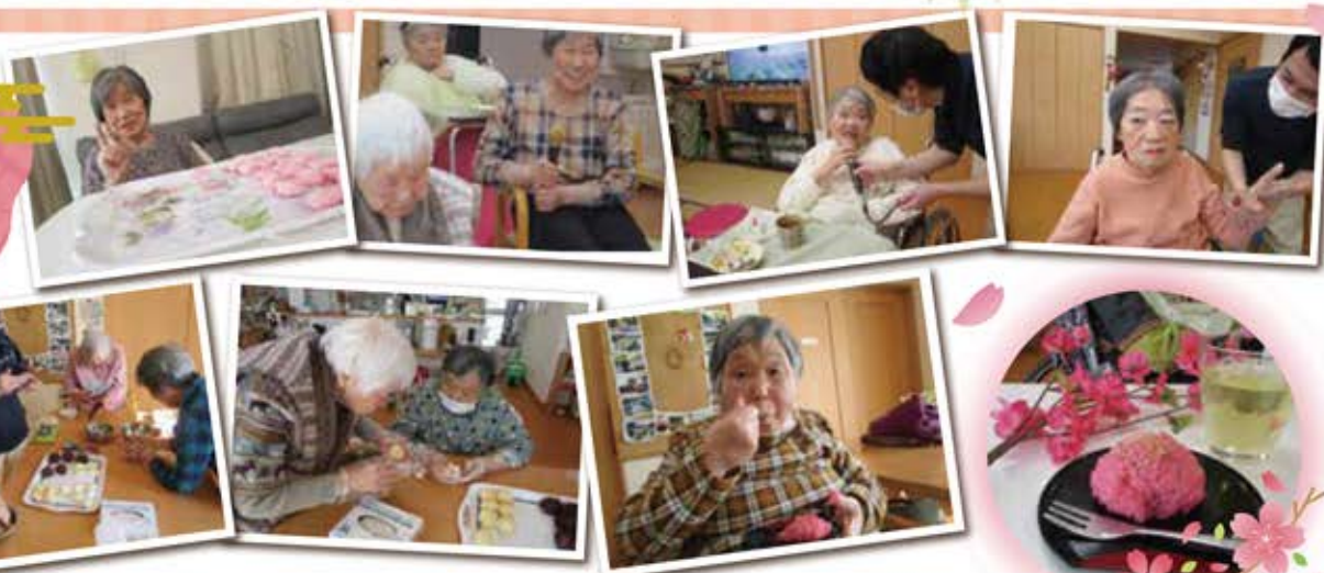
ハイチーズ！日常の一コマ、カメラを向けると素敵な笑顔に出会えました☆お彼岸のおはぎに舌鼓(^^)/春の訪れを感じます。