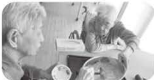
おやつにフルーチェ作りしました