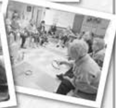
手作りのひな壇輪投げゲーム♪ 狙いを定めて高得点!! お嬢様の前ですまし顔 (^_^)/