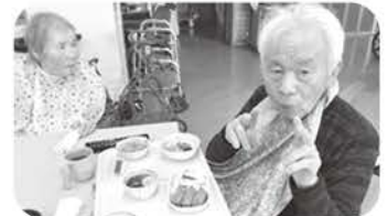
主食バイキングでは一度に3種類の 主食を楽しめます。