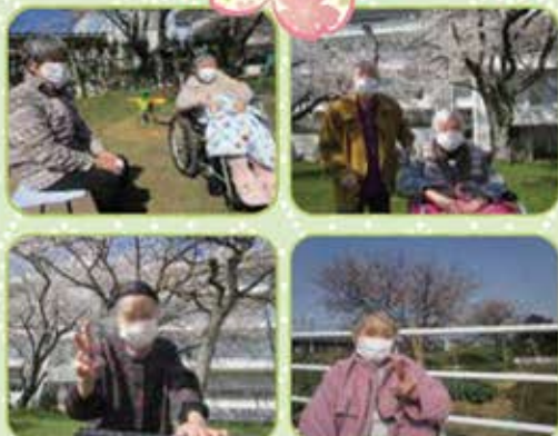
春の日差しに包まれて満開の桜！ 青空の下でハイポーズ！春の訪れを感じながら(^^)