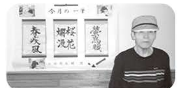
4月の「今月の一筆」になります