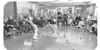
節分行事。 豆の代わりに紅白の玉で「鬼は外」