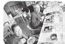
皆様大喜びの新年会献立