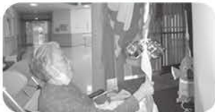
園内にある鯉々神社でお参り