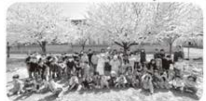
新しい仲間とお花見会をしました!

また、今年度からマスクの着用が「個人の判断」となりました。今まで我慢してきた遊びや行事を通して、たくさん笑顔が見られるよう職員一同支援して参ります。今年度も保護者・地域の皆様温かいご支援をどうぞよろしくお願いいたします。