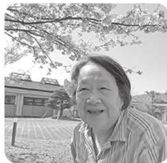
晴天の昼下がり、満開の桜を 楽しんでいただきました