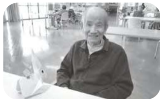
折り紙の兎との一コマ 素敵な一年になりますように