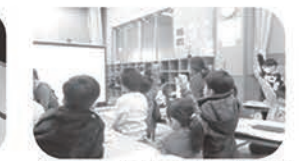
オンライン授業で野菜の勉強！