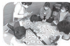
かるた大会！ 何枚取れたかな？