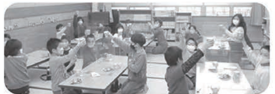
シャンメリーでかんぱ〜い！

今年度も終わりに近づいてきました。嬉しいことや楽しいこと、時には悔しいことや悲しいことを経験し、子どもたち一人一人が、それぞれのペースでしっかりと成長してきました。子どもたちの更なる成長を楽しみに、進級へ向けて準備を進めていきたいと思ひます。