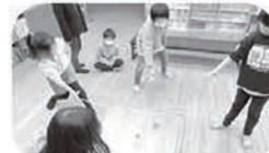
誰よりも長く回すぞ！