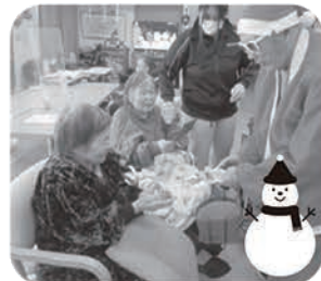
サンタさんからプレゼント♪ 体を動かしてから手作り ドーナツケーキを頂きました☆