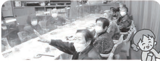
クリスマス会じゃんけんでプレゼント！