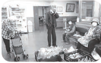
おなじみの八百屋さんで笑顔