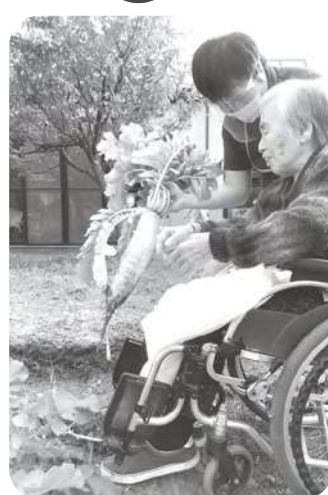
中庭の畑にて大根を収穫。良作ですね