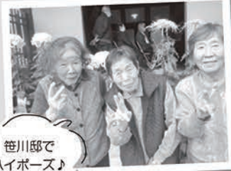
笹川邸でハイポーズ♪

コロナ禍での生活も3年... 感染予防をしながら皆さん楽しく過ごしていただいております (^_^) 味方公民館の文化祭に皆さんで作った作品を出しました☆ 事業所内でゲームや体操、出前ランチなど沢山笑って素敵な笑顔があふれています。