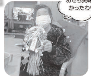
おせち美味し かったわ♡

あけましておめでとうございます 今年もよろしくお祈りします 縁起物のおせちを食べて、一年の健康を祈願