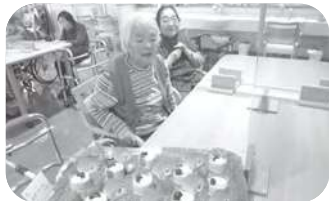
クリスマスケーキ♡いかがですか♡