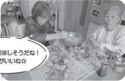
かきのもと美味しそうだね！ お浸しがいいね☆