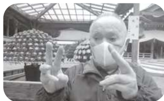
菊祭り行ってきたよ