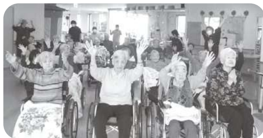
新年会 今年もよろしくお願ひします！