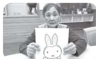
兎をテーマとした塗り絵 今年の干支にぴったりな作品です