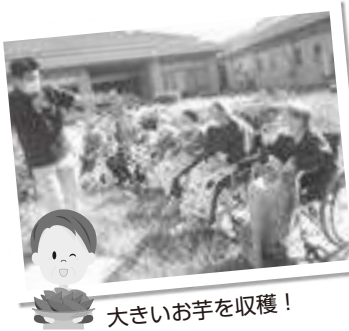
大きいお芋を収穫！