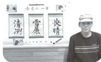
1月の「今月の一筆」 今回のテーマは冬景色