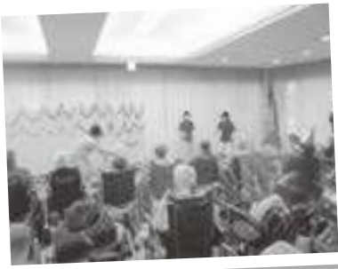
職員のマジックショー！