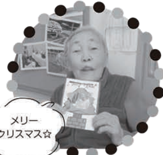
メリー クリスマス☆