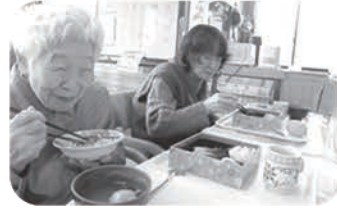
思わず顔もほころぶ新年会献立