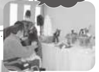
皆様の健康を願って…