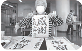
新年の私の気持ちです