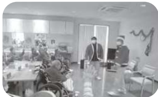
サンタのジェスチャーゲーム！ 手を挙げて！！