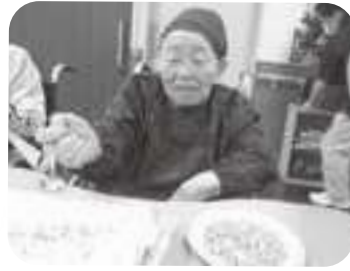
美味しい手作りケーキ♡