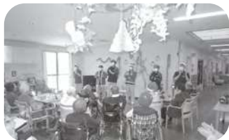
皆でクリスマスソング合唱