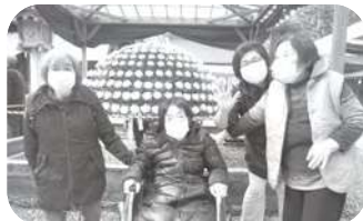
菊祭りてハイポーズ