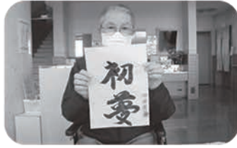
素敵な書初めでしょ