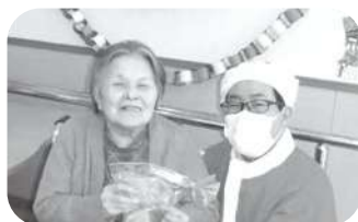
クリスマスプレゼントありがとう