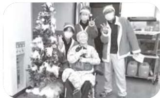
クリスマス会にて ケーキが振る舞われました