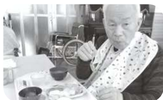
昼食で生寿司が振る舞われた 際の一コマ。美味しそう