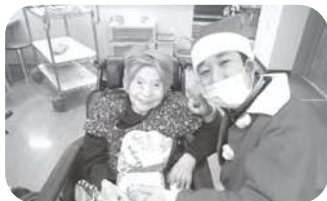
クリスマスプレゼント♡ありがとう♡