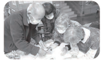
懐かしいイベントの記念写真観賞