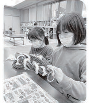
世界に一つだけのリースが完成♡