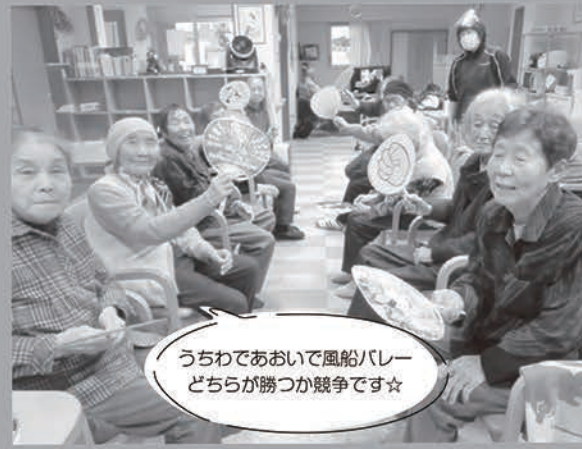
うちわであおいで風船パレー どちらが勝つか競争です☆