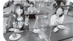
菜葉亭さんのケーキをいただきました♡

進級まで残りわずかですが、子ども達が立派なお兄さん、お姉さんになるために、職員一同全力で支えながら、共に笑顔で過ごしていきたいと思ひます。